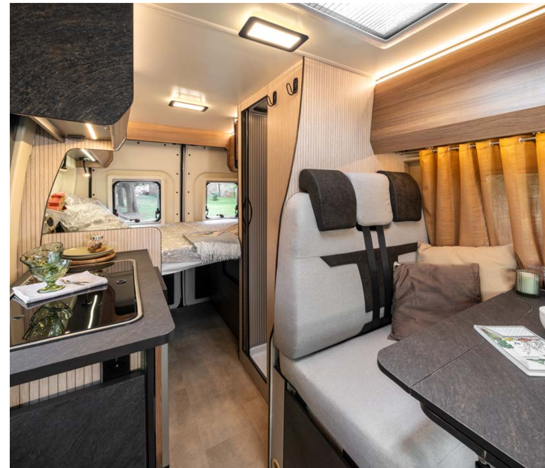
*Schlafplätze gesamt serienmäßig (einschließlich zusammensetzbare Betten)