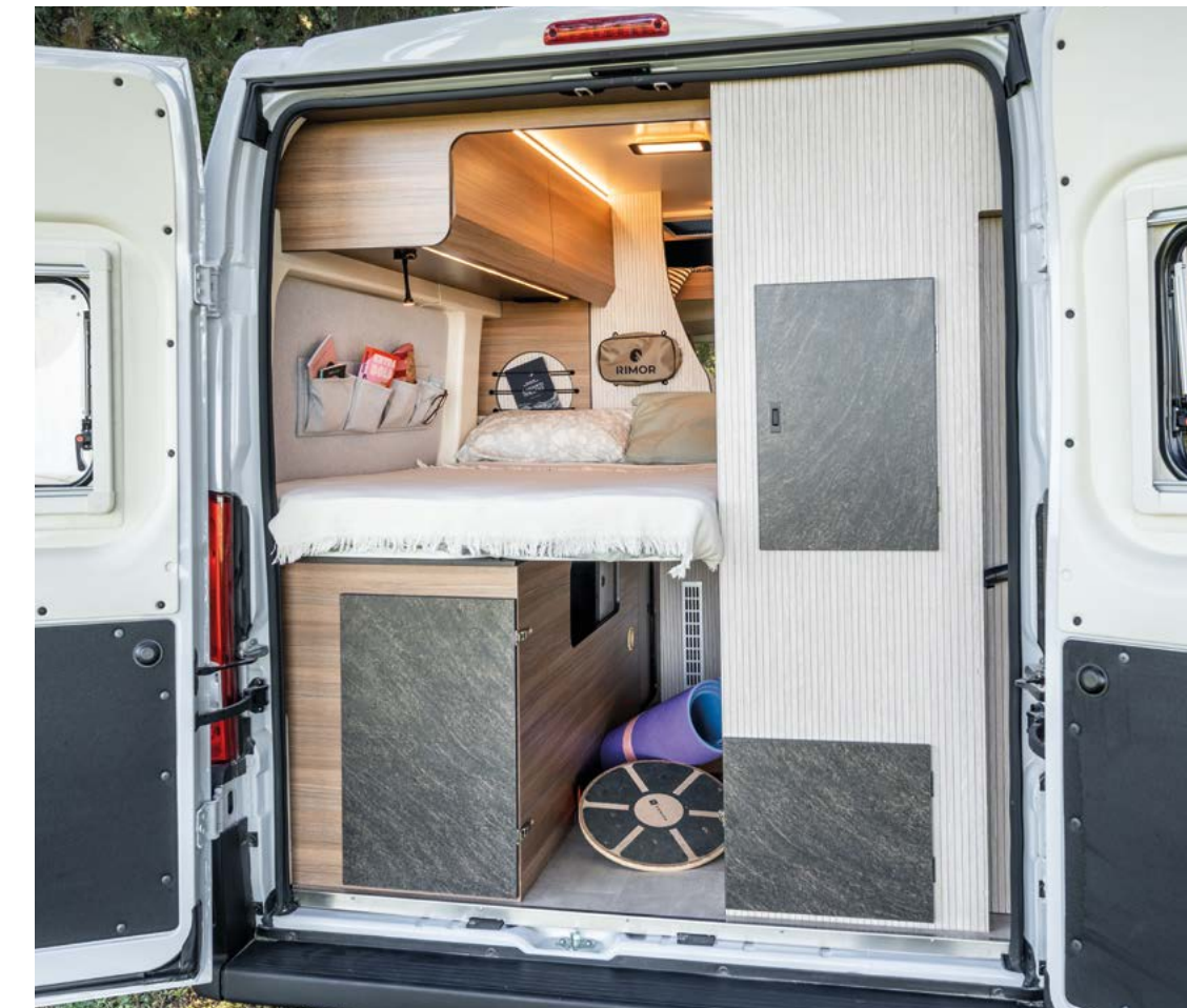
*Schlafplätze gesamt serienmäßig (einschließlich zusammensetzbare Betten)